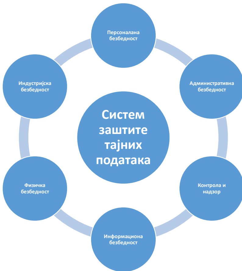
Приказ број 1: Систем заштите тајних података-елементи

Систем заштите тајних података, као вишеслојни систем заштите, служи циљу обезбеђења и усаглашеност са законским и институционалним захтевима, реализовања концепта заштите националне безбедности и успостављање међународне сарадње, као и високих стандарда квалитета корпоративног управљања и адекватног понашања, али и осигурања стварне одговорности и доброг система заштите тајних података.